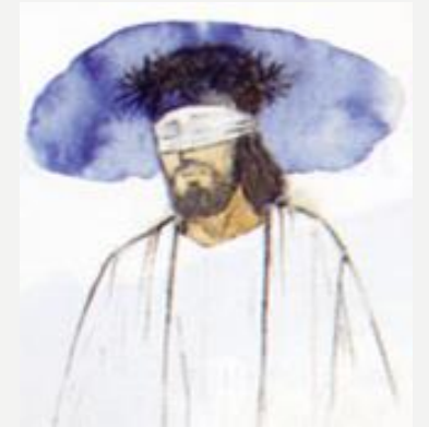
Le couronnement d'épines