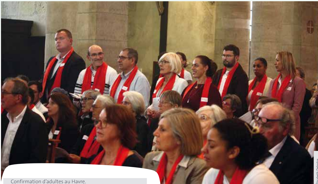
Confirmation d'adultes au Havre.