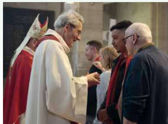
Le confirmand se présente avec son parrain.

Parmi les axes de réflexion, le SNCC propose de penser le mode d'intégration dès le temps du catéchuménat sans pour autant mettre en place un projet trop cadré. Il s'interroge également sur le rôle et le choix des parrains et marraines (famille? membres de la communauté?). Puis, il demande aux communautés de considérer la ma-