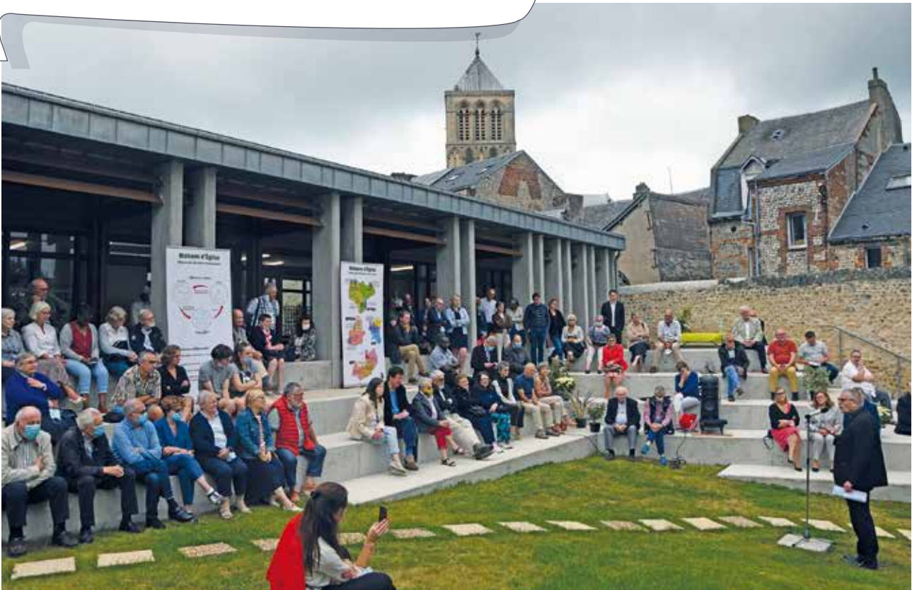
11 septembre 2021 : inauguration de la Maison d'Église L'Oasis à Fécamp.