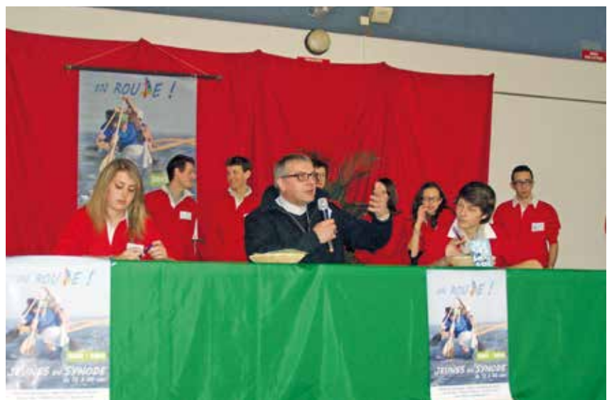
En 2013, Mgr Jean-Luc Brunin devant le synode des jeunes.

Convaincus aussi de la place des laïcs dans la vie de l'Église, les trois évêques ont mis en place des formations, leur permettant de remplir leur mission avec compétence. Ils ont impulsé la création des nouvelles paroisses plus conformes aux réalités humaines d'un temps de mobilité croissante, de recompositions territoriales, de réduction de la pratique religieuse et, surtout, de diminution