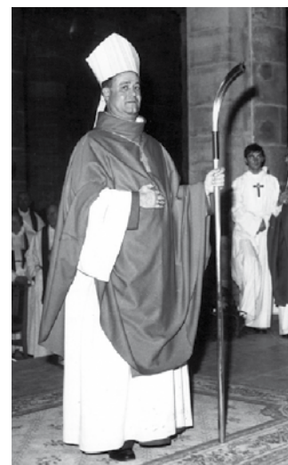
Ordination épiscopale de Mgr Michel Saudreau, premier évêque du Havre, le 22 septembre 1974.

La présence de l'Église dans le monde a toujours appelé des adaptations aux mutations politiques, sociales, culturelles, économiques, démographiques. L'évolution du maillage territorial de l'Église en résulte. Dans les années d'après-guerre, il est apparu très vite qu'il fallait opérer de nouveaux ajustements et que l'Église devait rapprocher sa structuration aux réalités du terrain, dans l'esprit du concile Vatican II. Le diocèse, dans la tradition qui remonte aux origines même de l'Église, est bien le marqueur territorial de la succession apostolique. L'annonce de l'Évangile s'incarne dans une terre singulière. L'unité de l'Église se nourrit de la diversité des êtres, des cultures, des traditions, mais aussi des capacités de création de chaque territoire. C'est pourquoi,