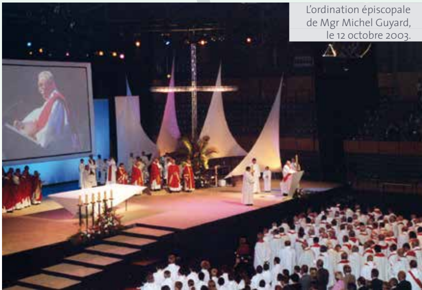
L'ordination épiscopale de Mgr Michel Guyard, le 12 octobre 2003.

du nombre de prêtres susceptibles de desservir les communautés de croyants. L'un des grands défis de l'Église diocésaine est précisément de vivifier le presbyterium, constitué de prêtres naguère incardinés dans le diocèse de Rouen, de prêtres ordonnés au service du nouveau diocèse, de prêtres Fidei Donum , venus principalement d'Afrique, accompagnés par des diacres permanents.