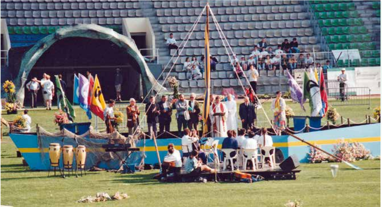
Le 23 juin 1996, Fêt'Église clôture le synode diocésain au stade Deschaseaux.

de l'ensemble « Haropa Port ». Le Havre est le point focal d'une vallée industrielle en profonde mutation, raffinage, industrie automobile, chimie, cimenterie, production d'énergie, mécanique, aéronautique, machines diverses. Cette activité souffre de la concurrence internationale et de la stratégie planétaire des grands groupes mondialisés. Elle est aussi mise en accusation pour ses nuisances, ses pollutions, les risques qu'elle engendre. Mais elle est pourvoyeuse d'emplois, créatrice d'emplois et de richesses. Les conflits qu'elle suscite sont aussi un moteur de progrès, car ils provoquent à chercher des solutions nouvelles, signe de l'intelligence humaine.