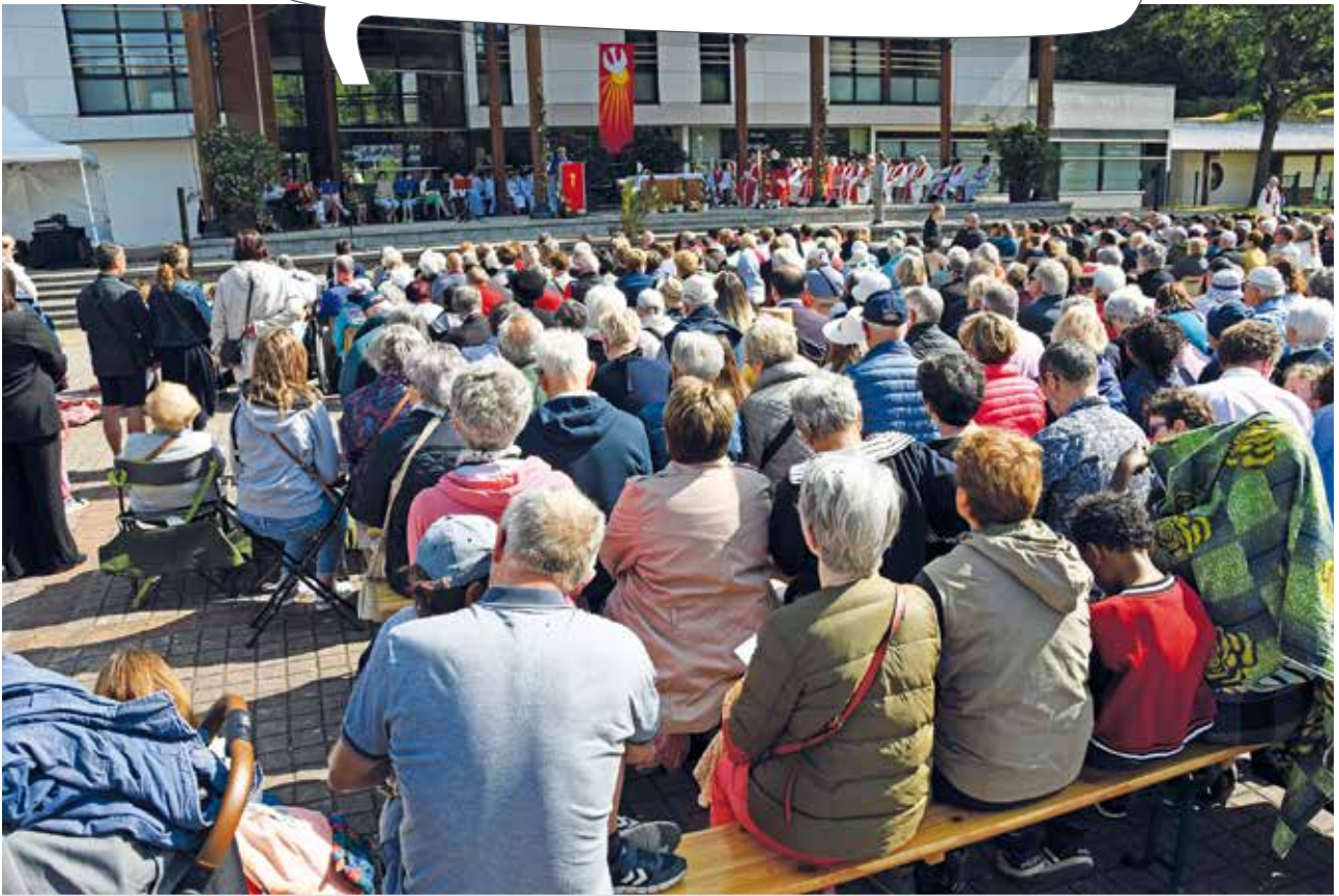
Rassemblement diocésain à Bolbec le 29 mai 2023. Tous en chemin au souffle de l'Esprit.